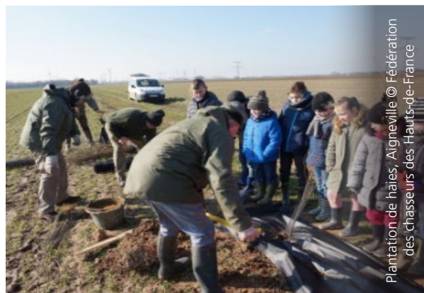
Plantation de haies, Aigueville