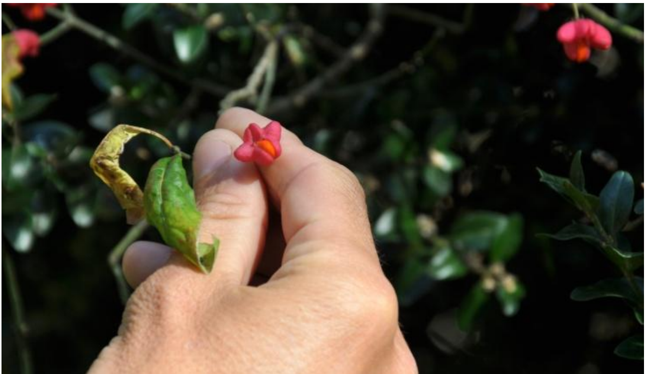
Collecte de graines.

→ Pour une présentation didactique et détaillée du passeport phytosanitaire : la présentation de Plante et Cité est très complète.