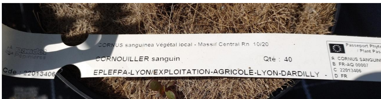
Photo : Etiquette VL et passeport phytosanitaire.

Le passeport phytosanitaire se présente sous forme d'étiquettes à imprimer par le producteur ou est matérialisé sur le document qui circule avec les végétaux. Il doit être apposé sur l'unité commerciale des végétaux ou sur l'emballage, la botte ou le conteneur.